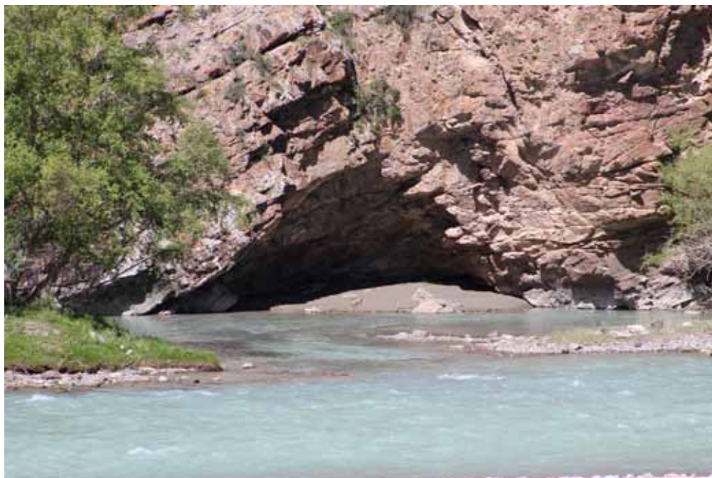
Эр Табылдынын үңкүрү, Нарын району