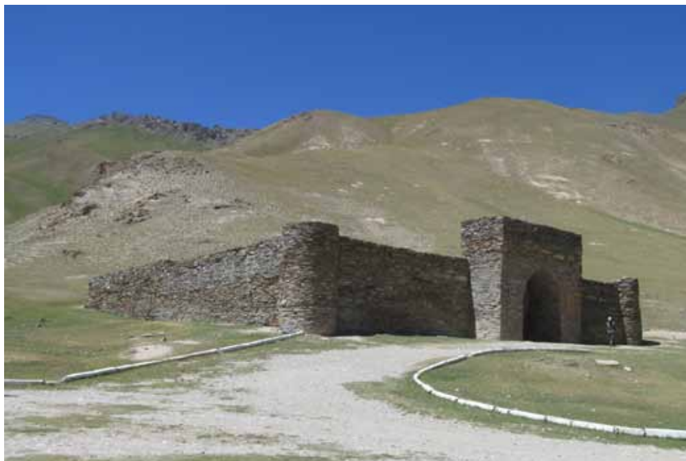
Таш-Рабат, Ат-Башы району