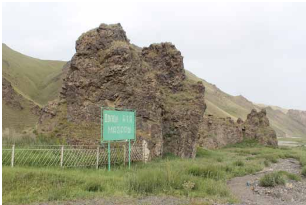
Долон-Ата, Кочкор району