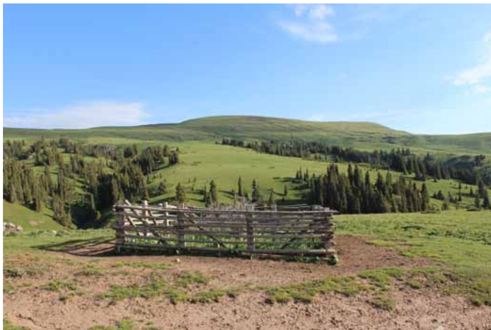
Ыманбек молдонун жери, Нарын району