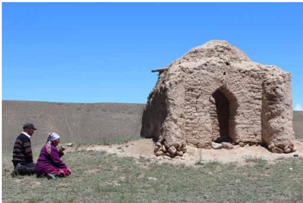
Шадыкан-Ата күмбөзү, Нарын району