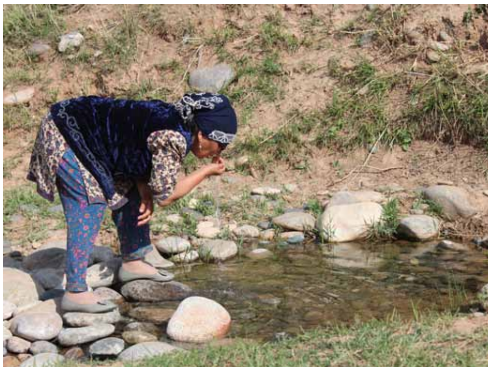
Жылуу-Суу, Нарын району