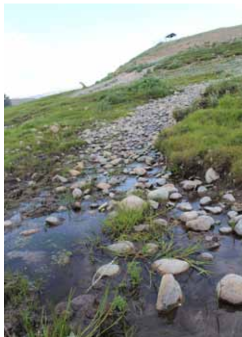
Миң-Булак, Нарын району