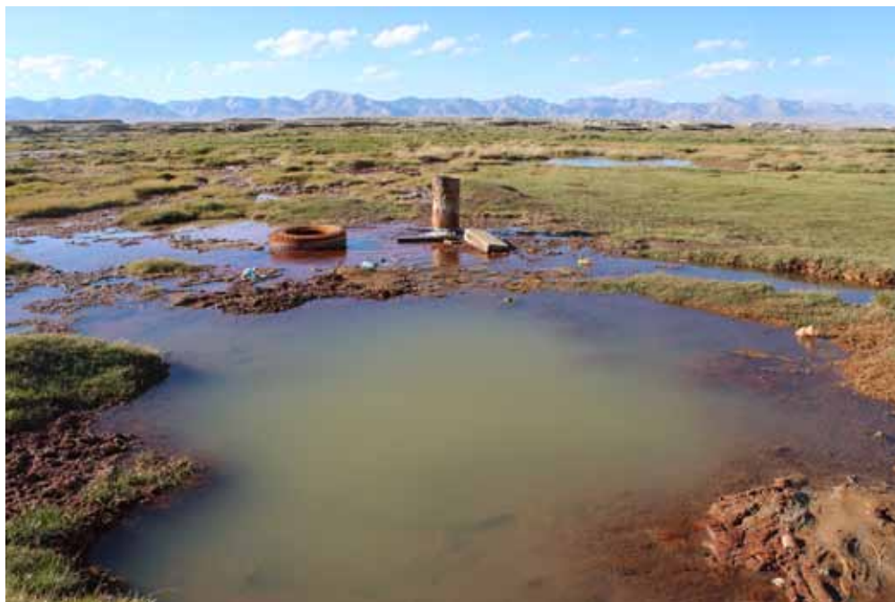
Нарзан-Суу, Ат-Башы району