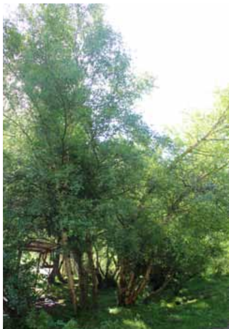
Үч-Кайың, Нарын району