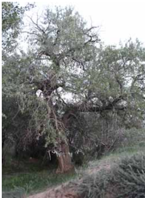
Жалгыз-Терек, Нарын району