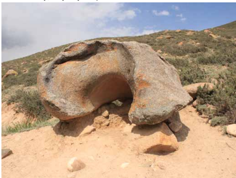
Тешик-Таш, Нарын району