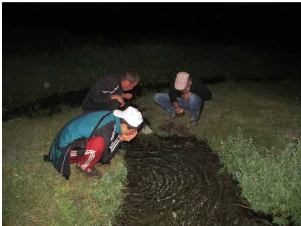
Май-Булак мазары, Ат-Башы району