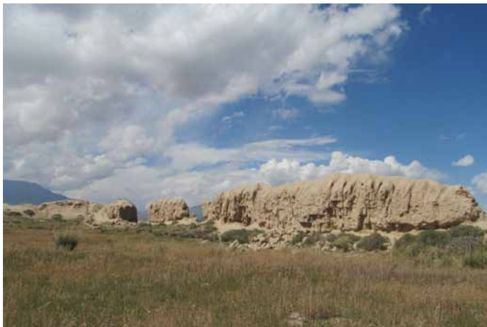
Кошой-Коргон, Ат-Башы району