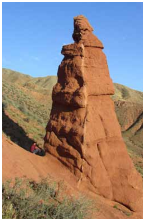
Бурана-Апа, Жумгал району