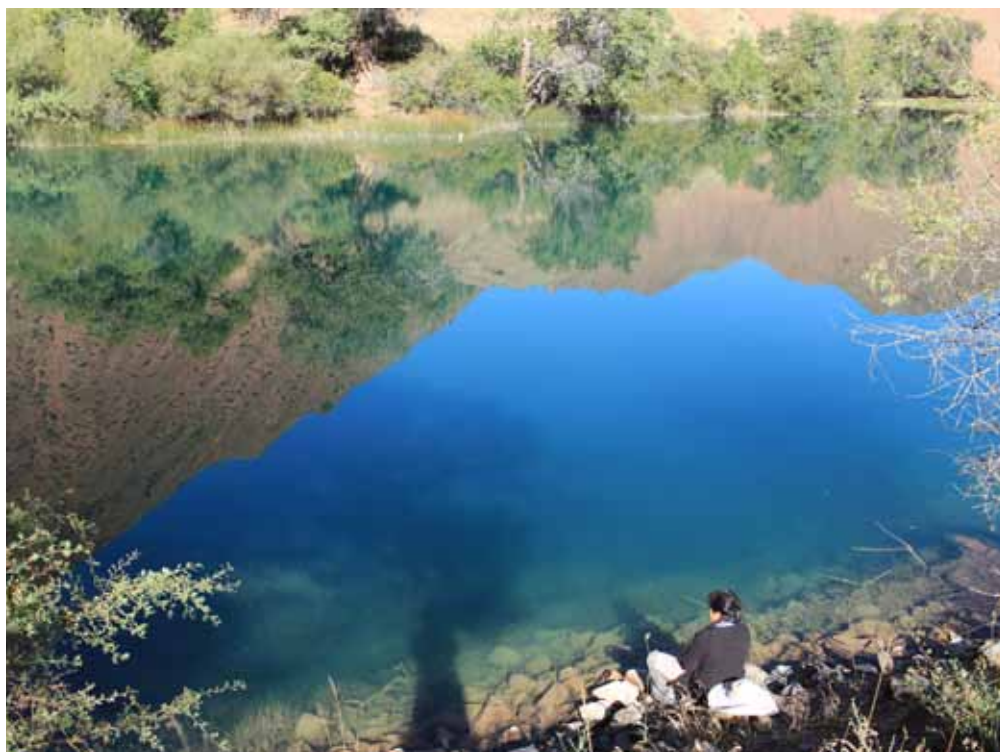
Ак-Көл, Жумгал району