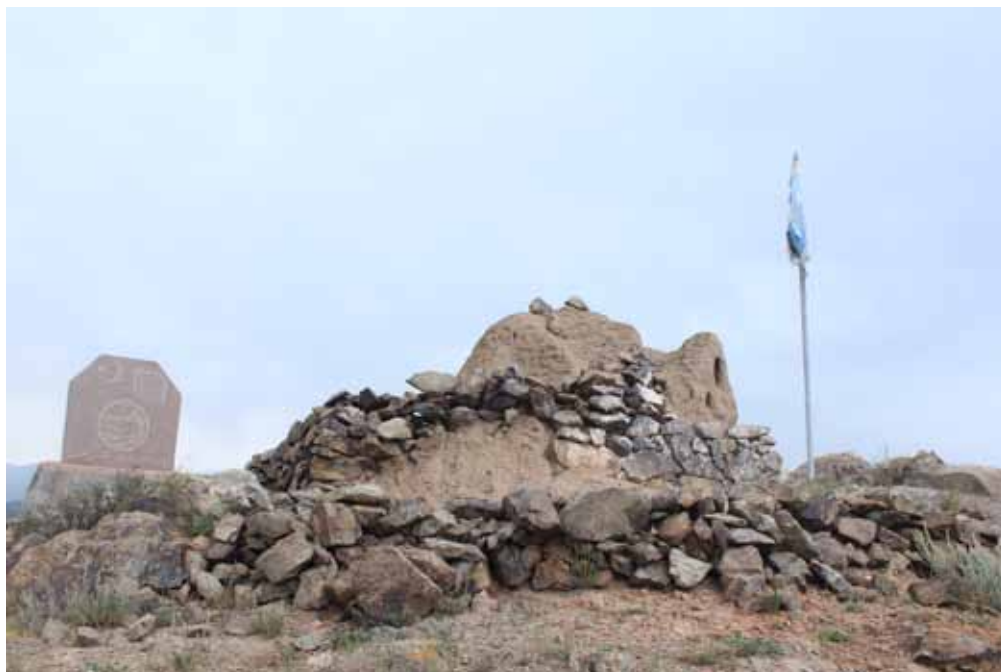
Ак-Мазар, Кочкор району