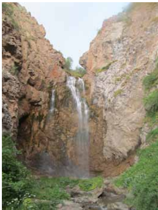
Шаркыратма, Ат-Башы району