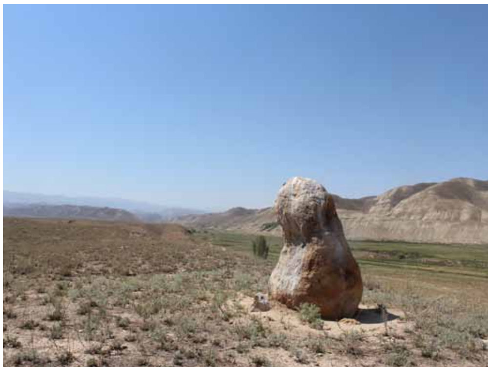
Соку-Таш, Ак-Талаа району