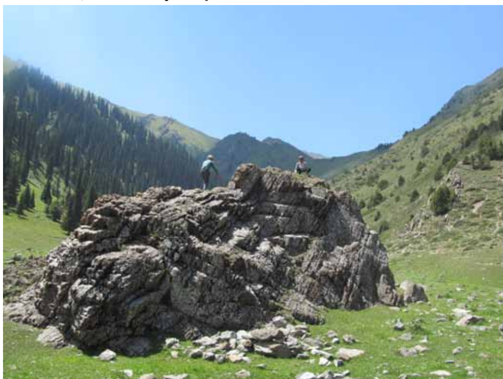
Чоң-Таш, Ак-Талаа району