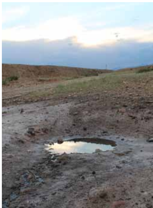
Туз-Булак, Нарын району