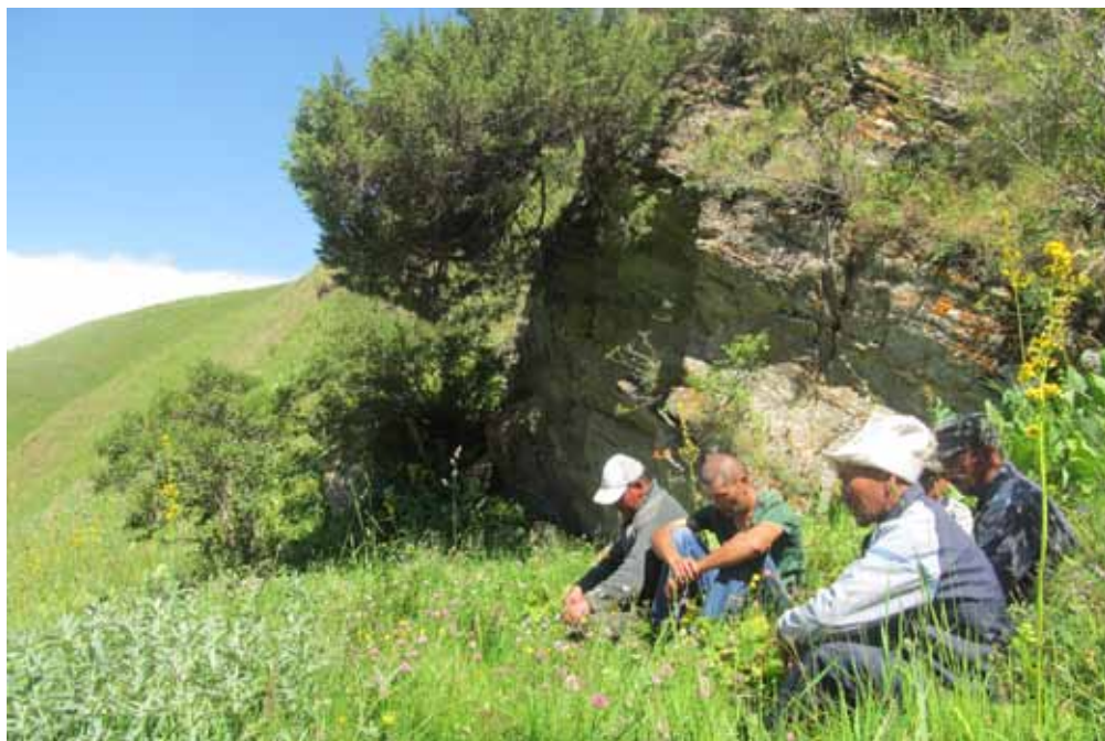
Тегерек-Булак, Ат-Башы району