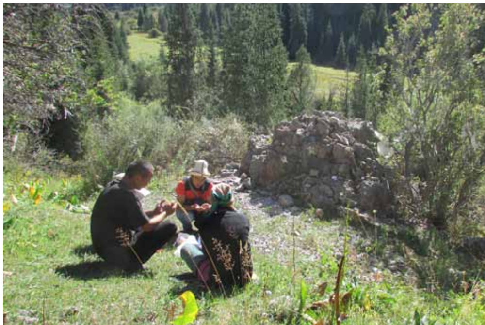
Чөйчөк-Таш, Жумгал району