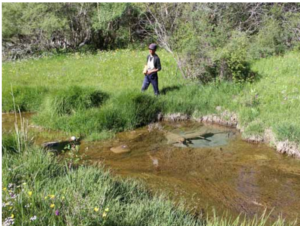
Эр Табылдынын булагы, Нарын району