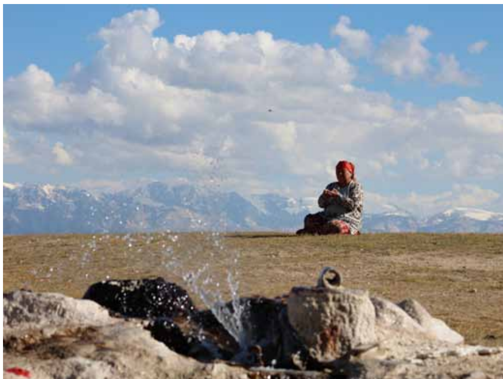
Арашан, Ат-Башы району