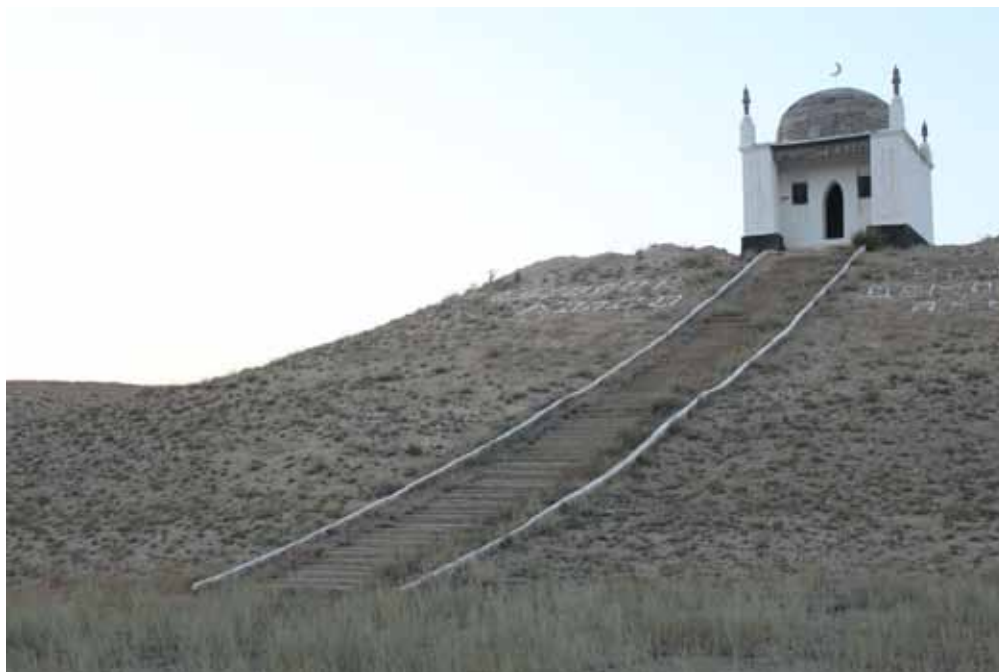
Тоголок Молдо кумбөзү, Ак-Талаа району