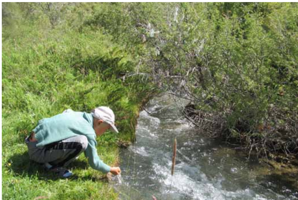
Козуке, Ак-Талаа району