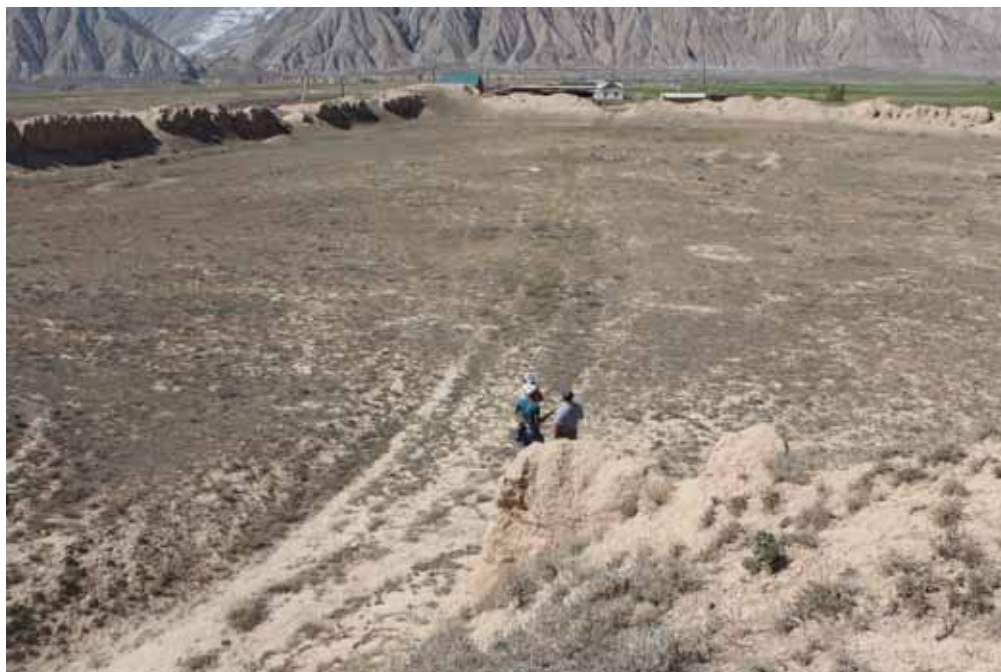
Шырдакбектин чеби, Ак-Талаа району