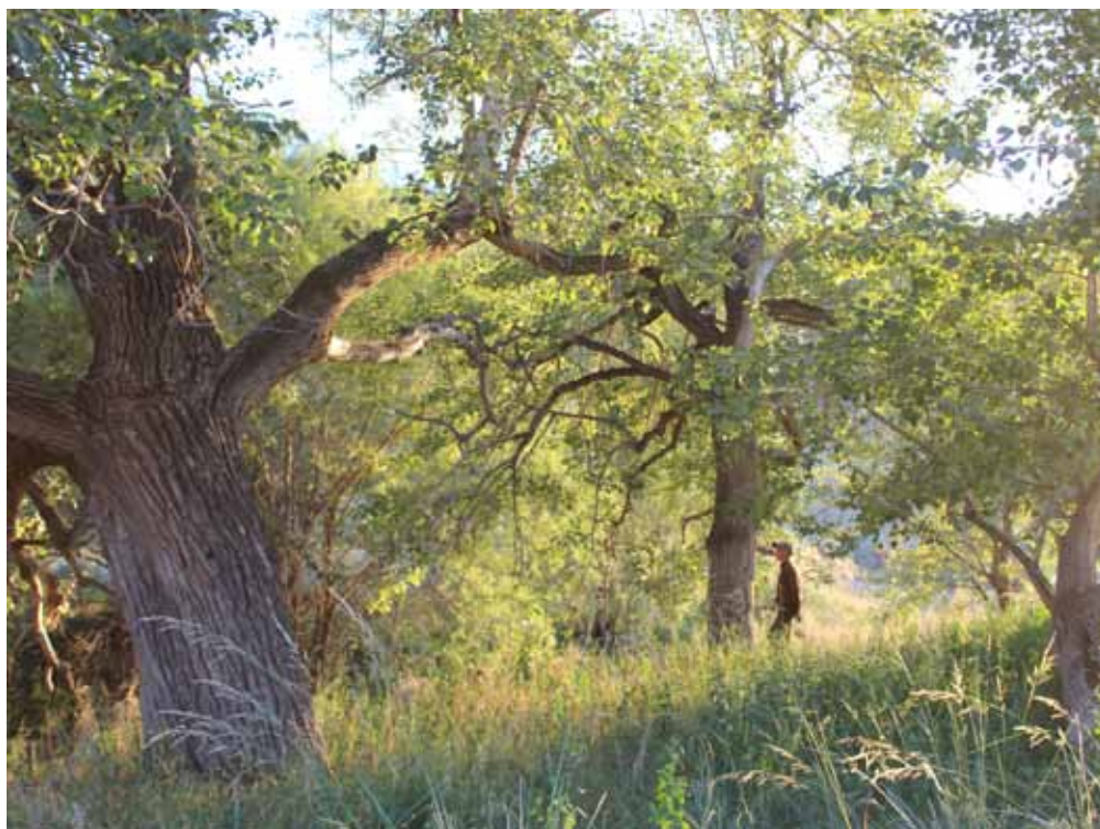
Кашка-Терек, Жумгал району