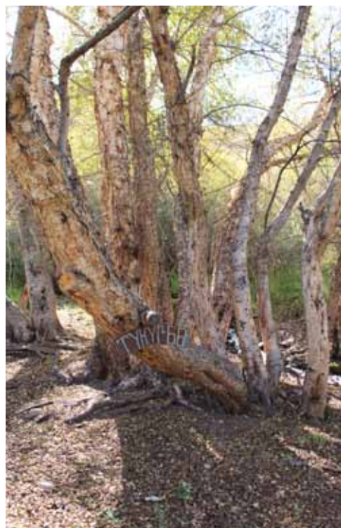
Жумгал-Ата, Жумгал району