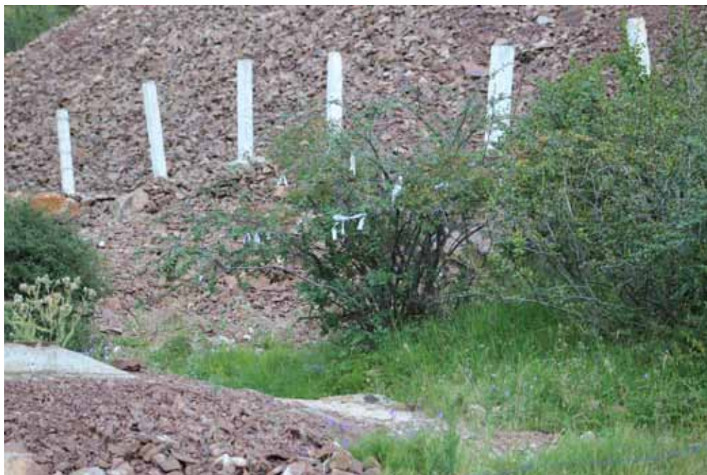
Кыз-Мазар, Нарын району