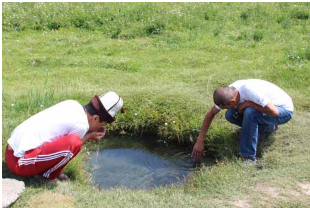
Чеч-Дөбөнүн булагы, Ат-Башы району