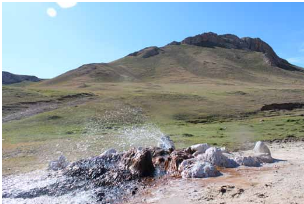
Арашан, Ат-Башы району