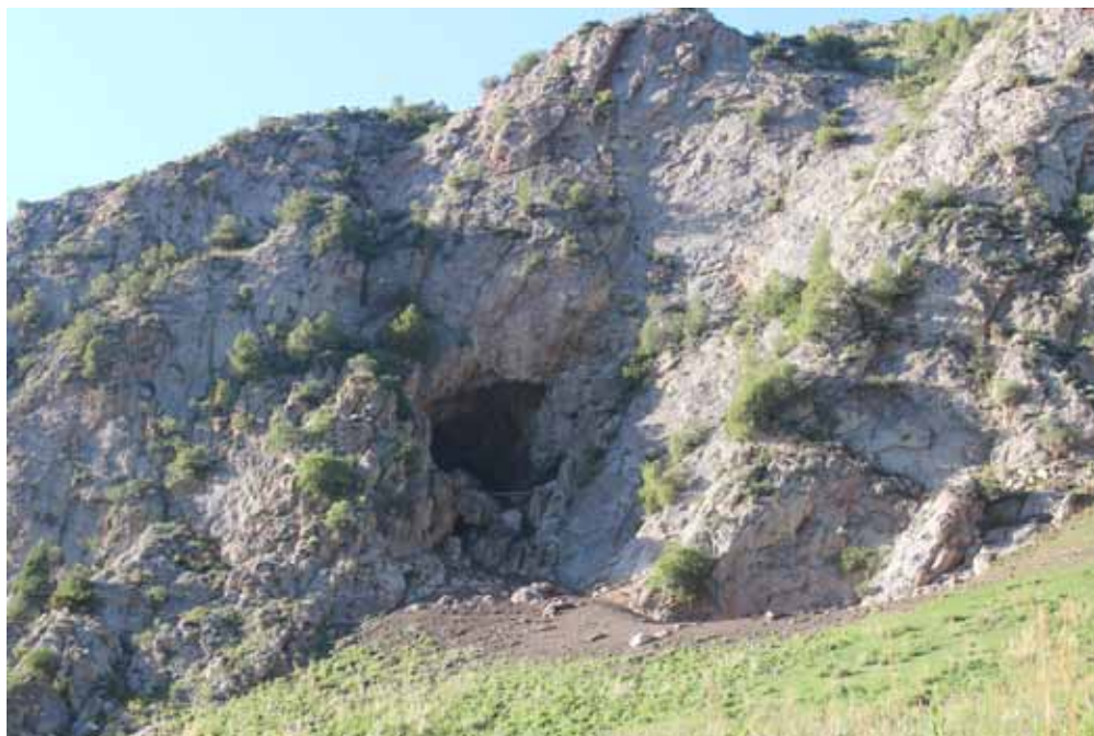
Кожо-Үңкүр, Нарын району