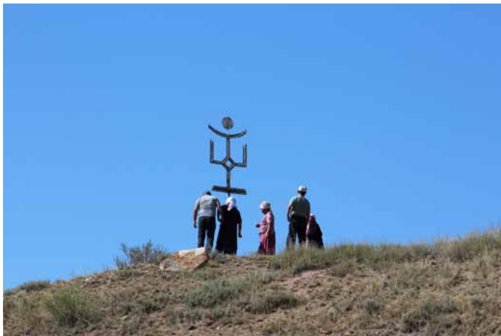
Түгөл-Ата, Жумгал району