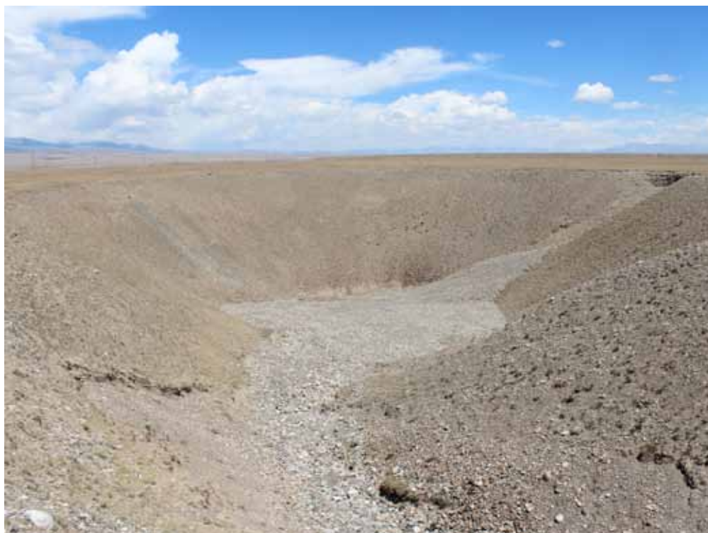
Кыз-Сайкалдын ору, Ат-Башы району