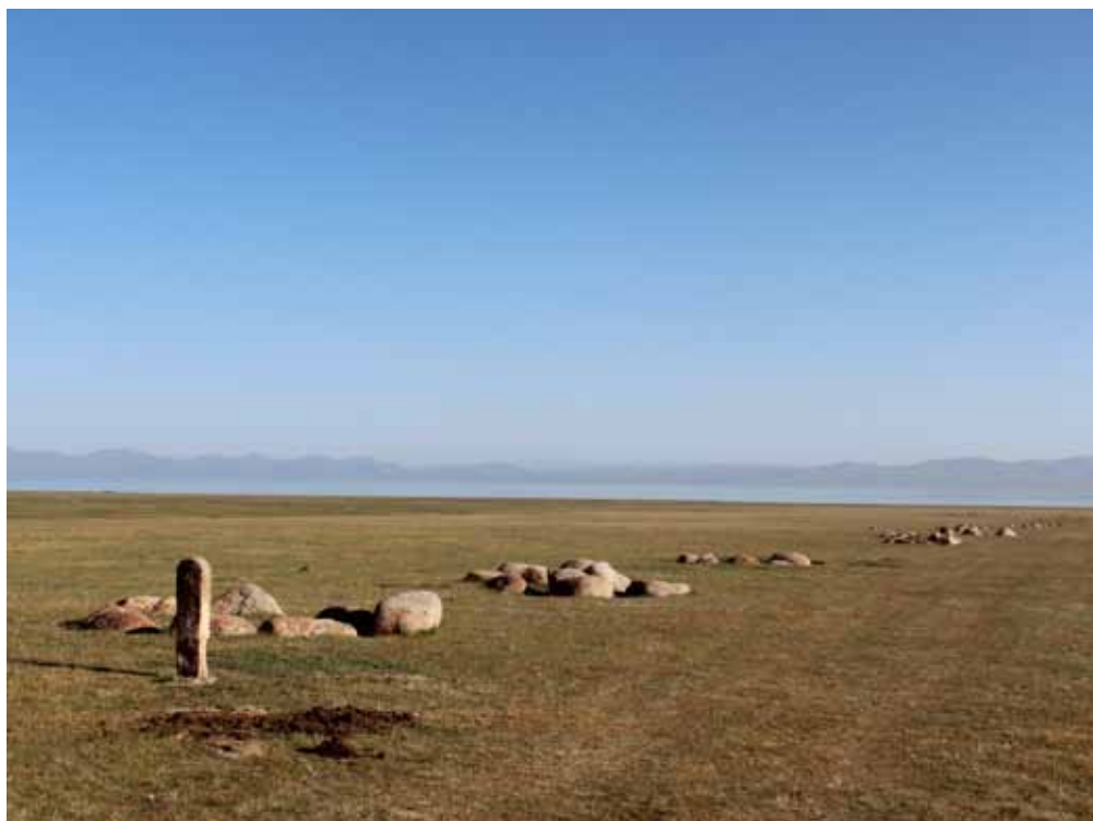
Манастын таш тулгасы, Ак Куланын мамысы, Соң-Көл, Ак-Талаа району