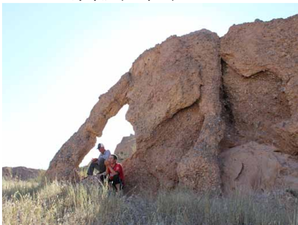
Көзөнөк-Таш (чыгыш), Жумгал району