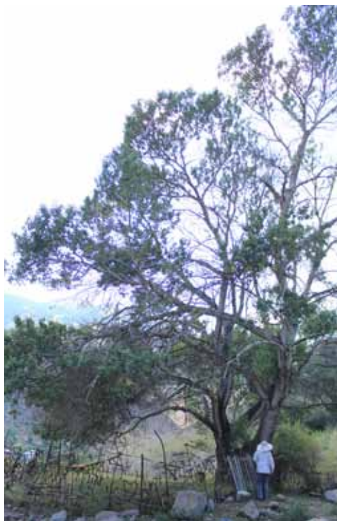
Ак-Терек, Жумгал району