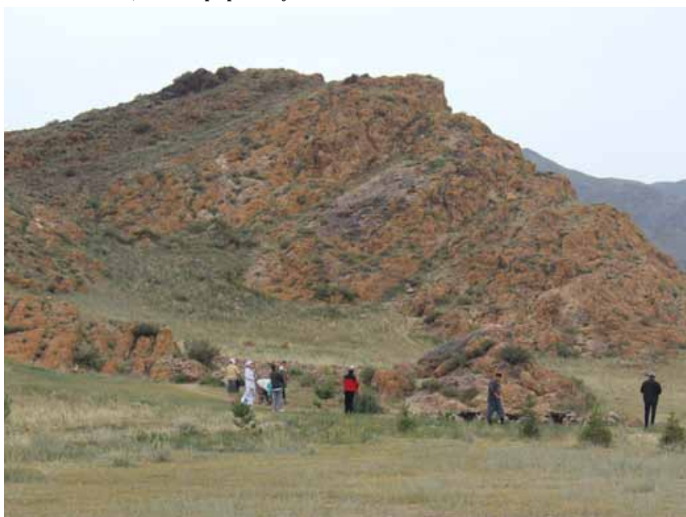
Кочкор-Ата мазары, Кочкор району