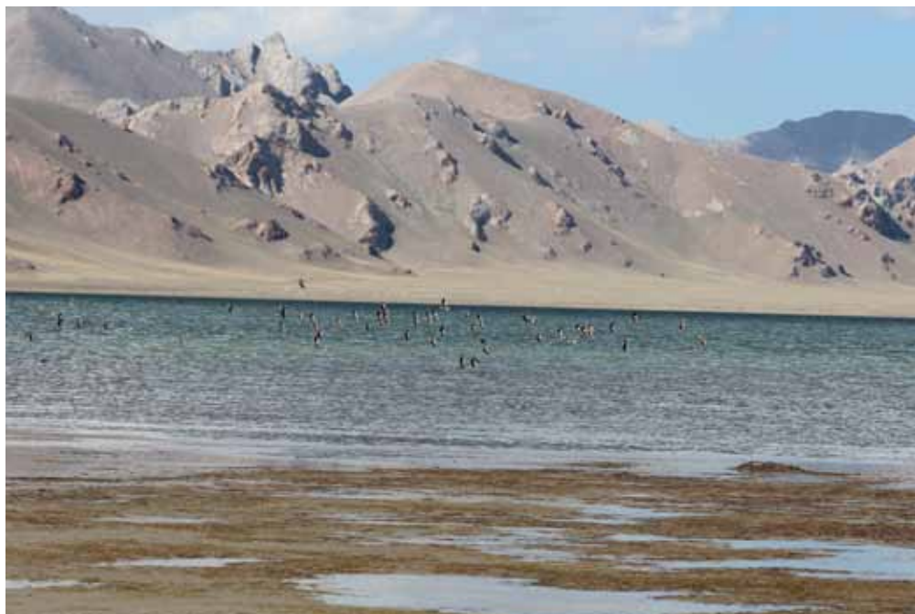
Чатыр-Көл, Ат-Башы району