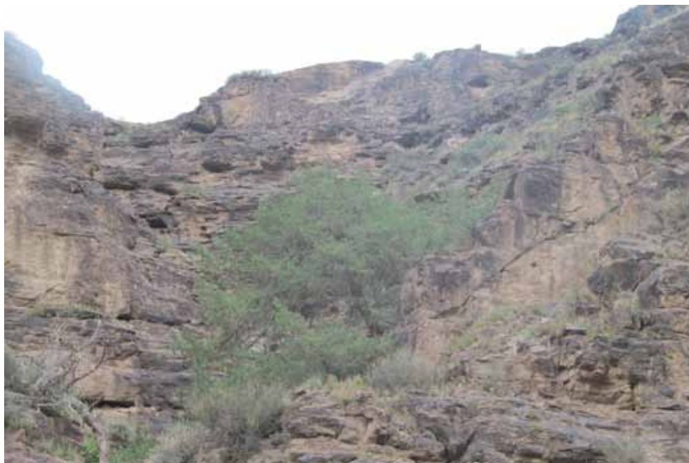
Арчалуу-Мазар, Кочкор району