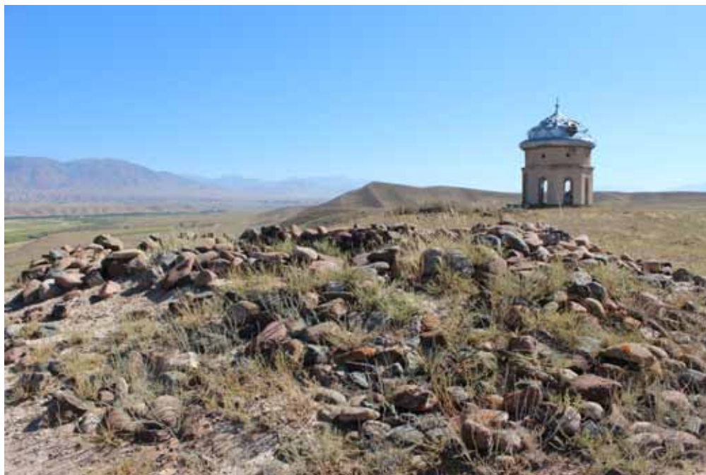
Жумгал-Ата мазары, Жумгал району