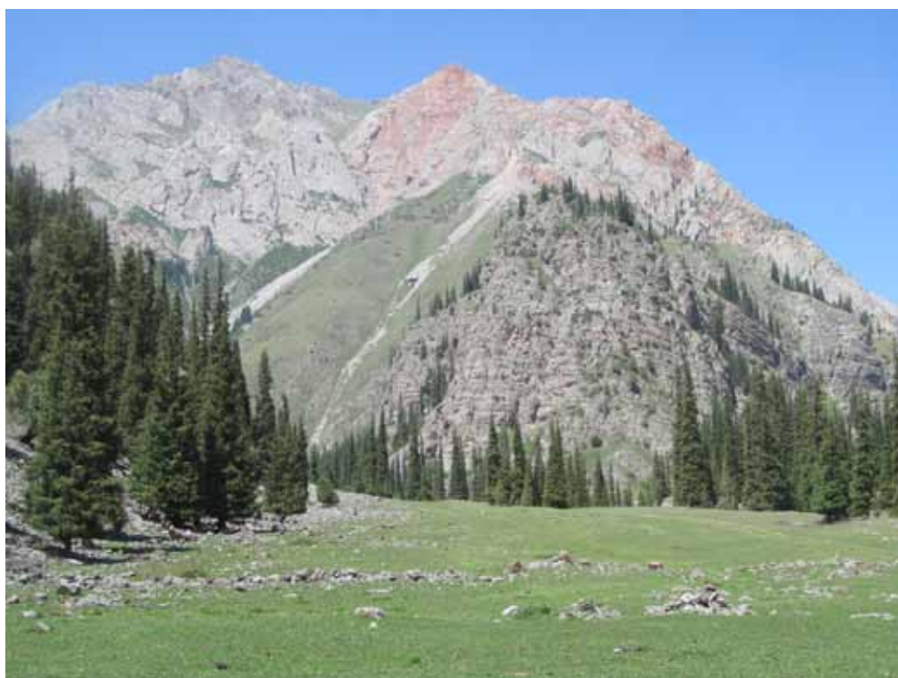
Кырк кыздын чеби, Ак-Талаа району