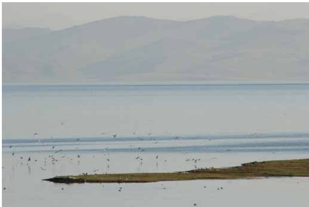
Соң-Көл, Ак-Талаа району