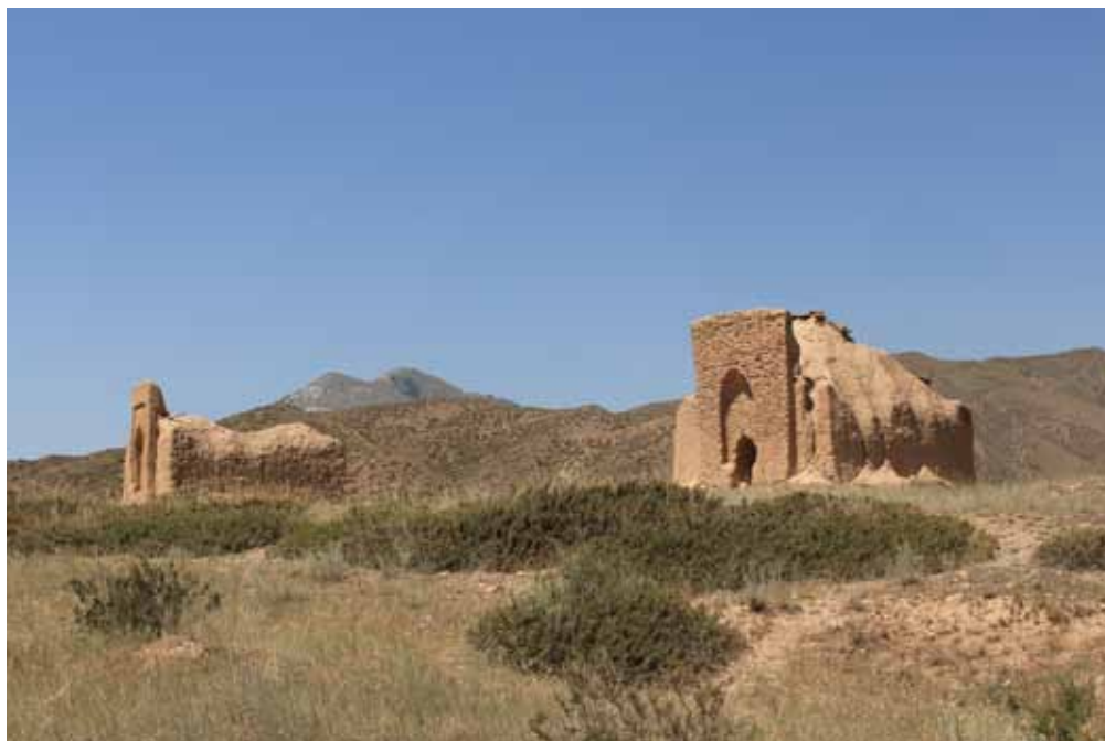
Кемпир баатыр жана Чомой баатыр күмбөзү, Ак-Талаа району