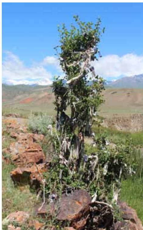
Жалгыз-Шилби, Нарын району