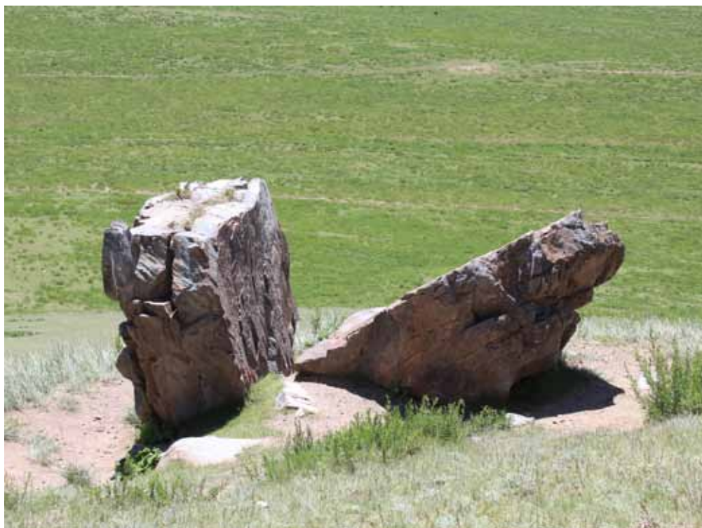
Эр Табылдынын ташы, Нарын району