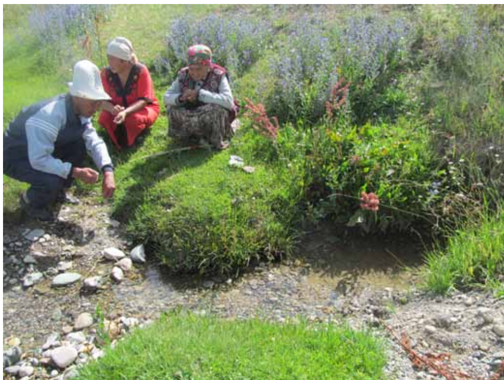
Токтокан молдонун булагы, Нарын району