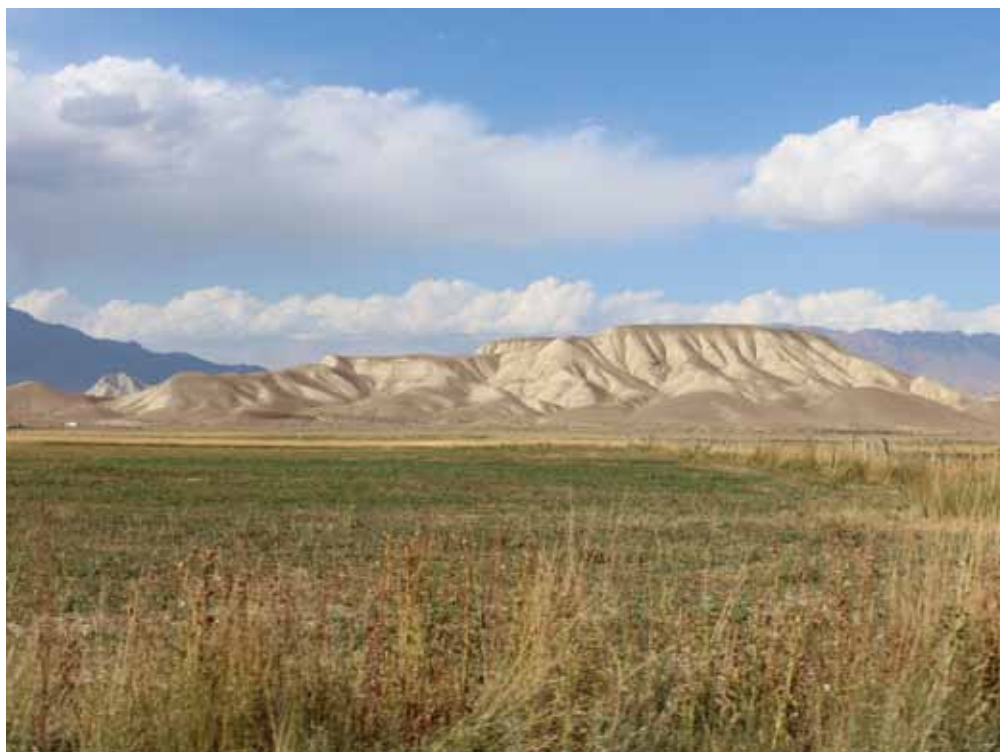
Чеч-Дөбө, Ат-Башы району