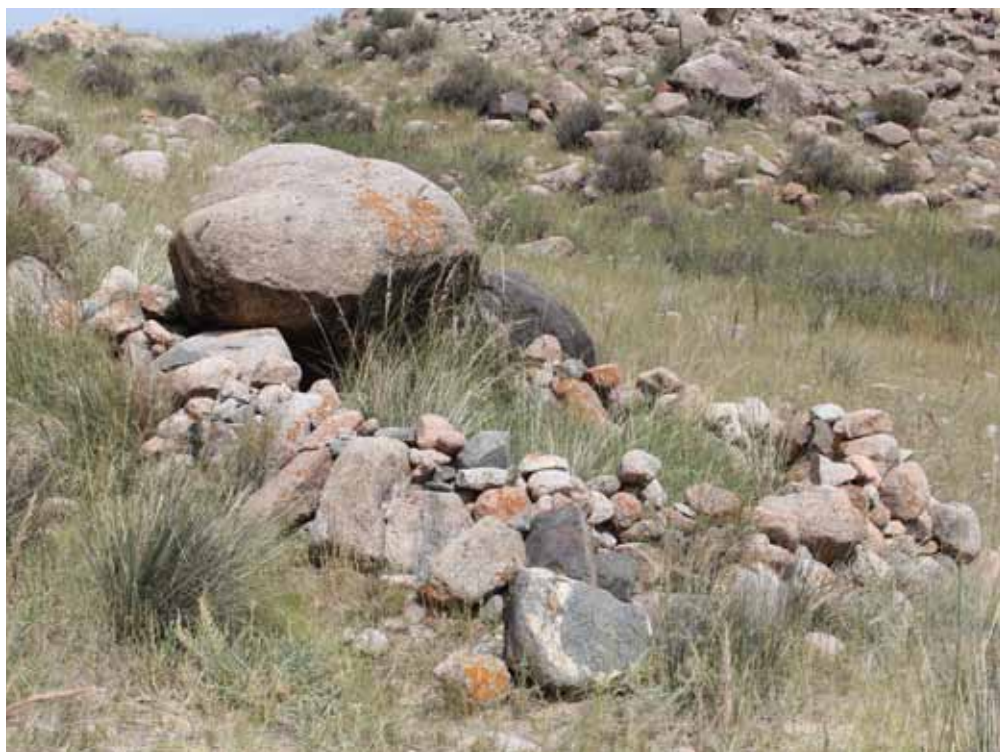
Тешиктин оюндагы мазар, Кочкор району