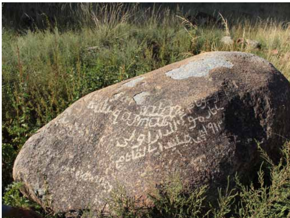
Арап тамга таш, Жумгал району