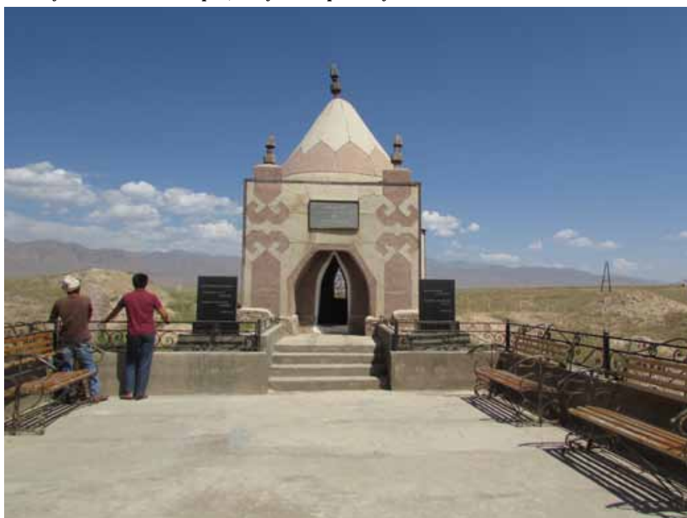
Куйручук Атанын күмбөзү, Жумгал району