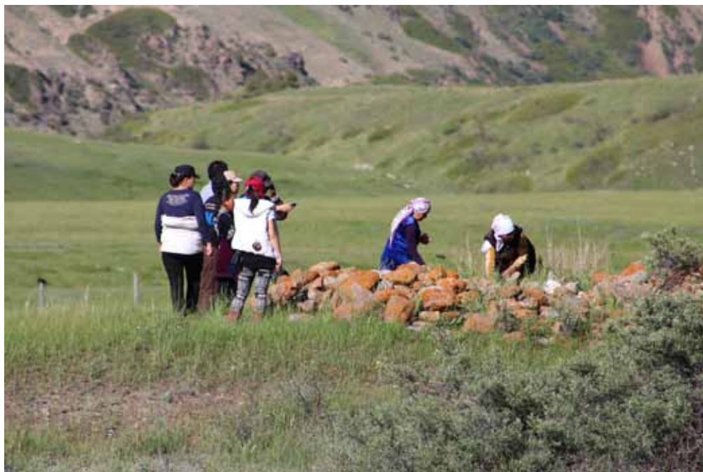
Кара-Таш, Нарын району