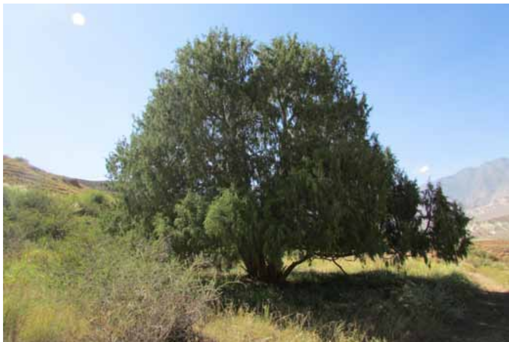
Мазар-Арча, Жумгал району