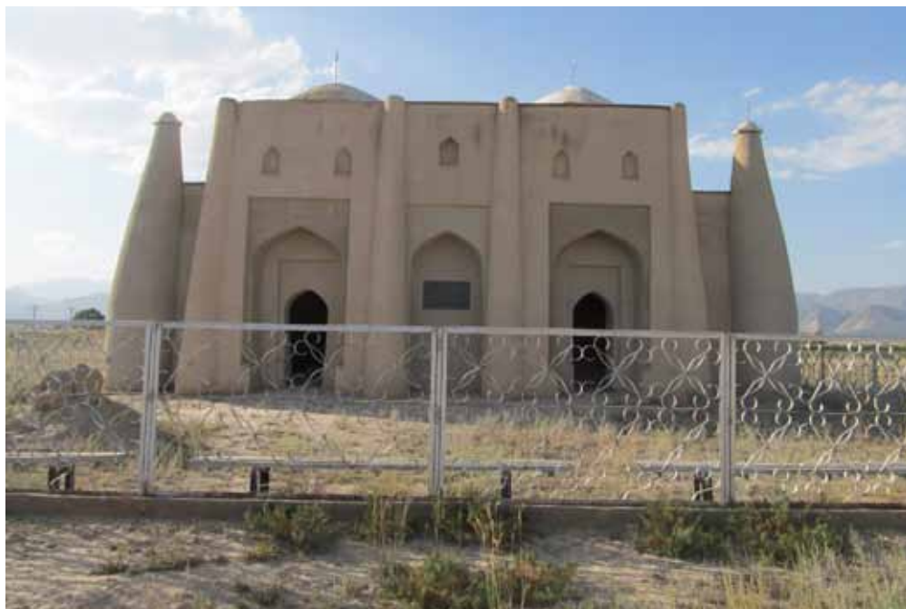
Атантай, Тайлак баатырлар күмбөзү, Ак-Талаа району