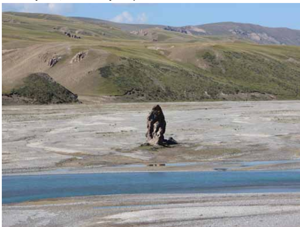
Чатыр-Таш, Ат-Башы району