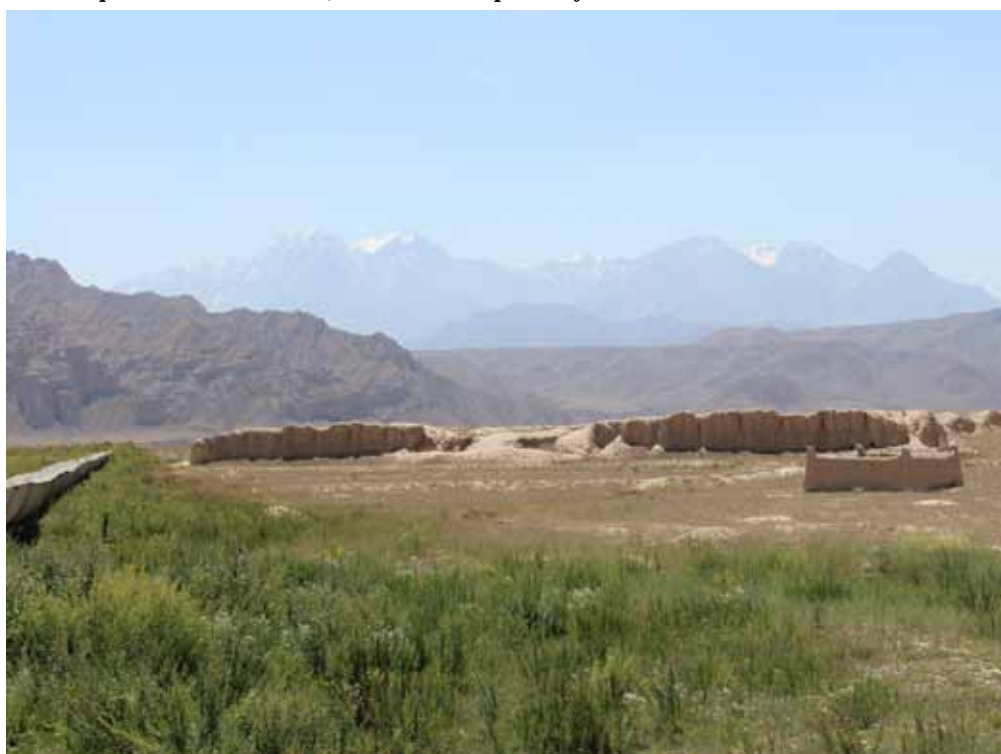
Шырдакбектин коргону, Ак-Талаа району