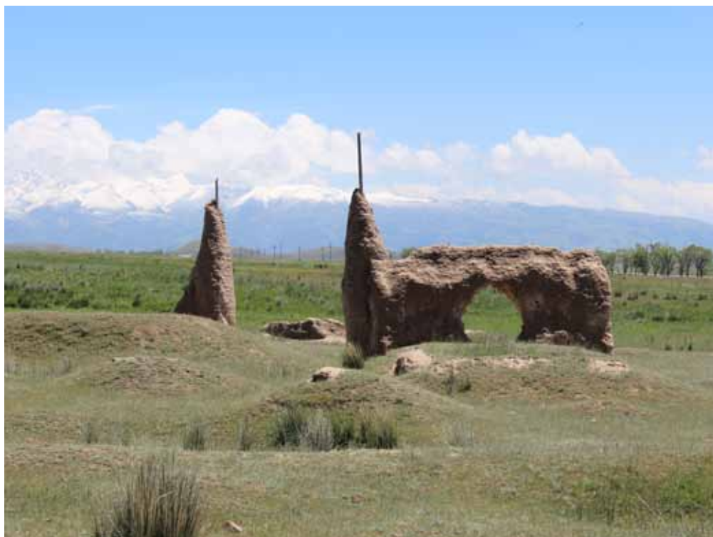
Шопок баатыр жана Төлөмүш күмбөзү, Нарын району