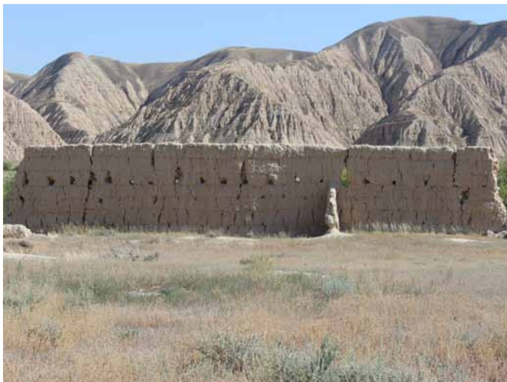
Чолок коргон, Ак-Талаа району