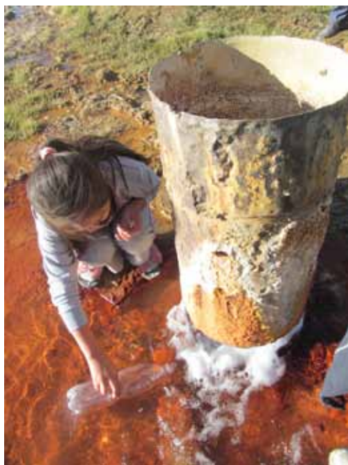
Нарзан-Суу, Ат-Башы району