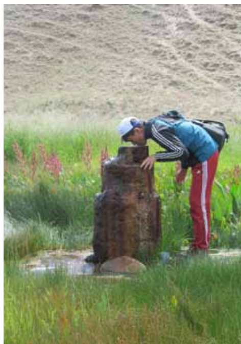
Жылуу-Суу (Кара-Суу), Ат-Башы району