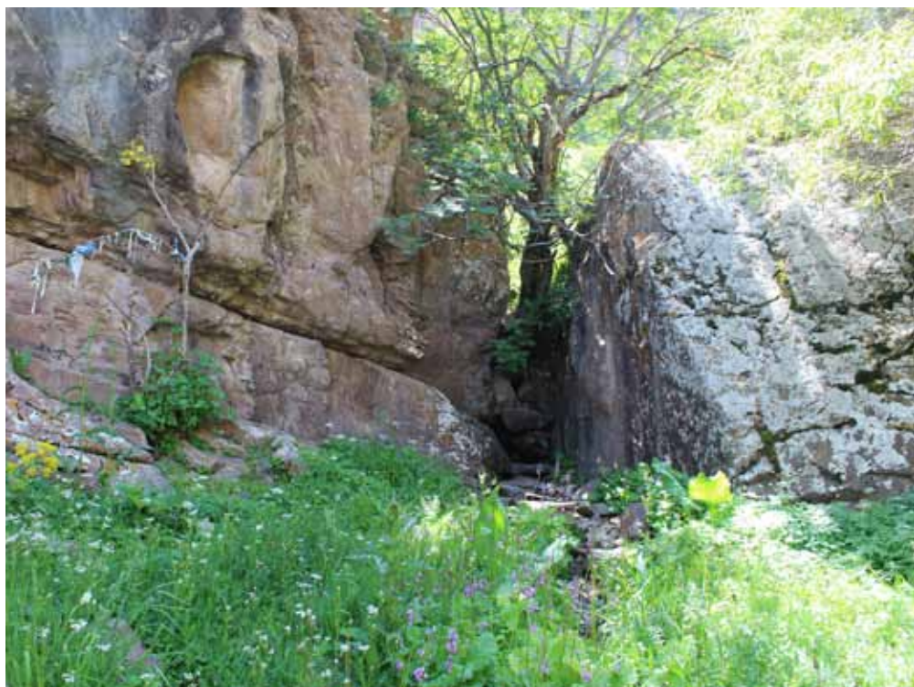
Кургак-Булак, Нарын району