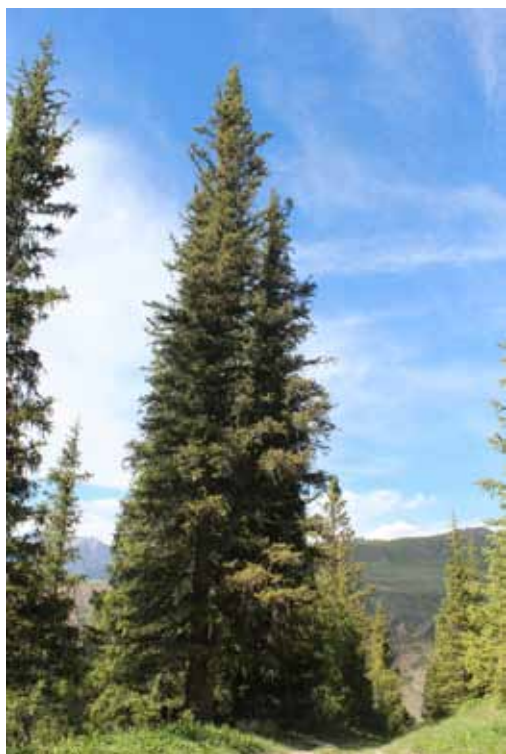
Мазар-Карагай, Нарын району