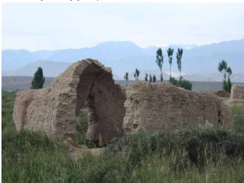
Кырк чоронун күмбөзү, Кочкор району