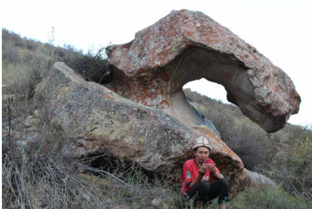
Көзөнөк-Таш (түндүк), Жумгал району