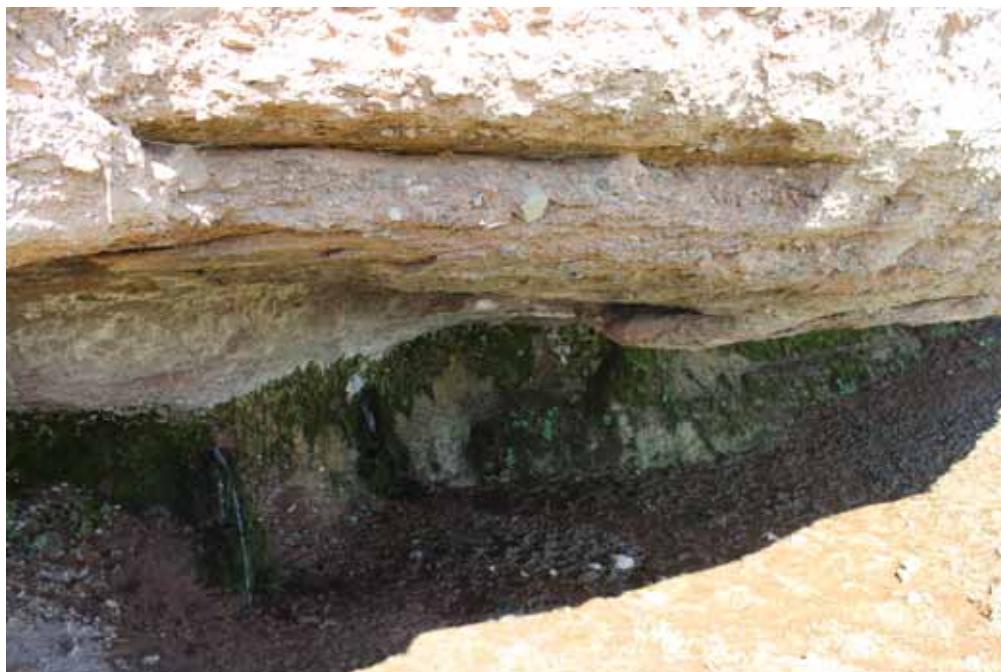
Тогуз-Булак, Жумгал району