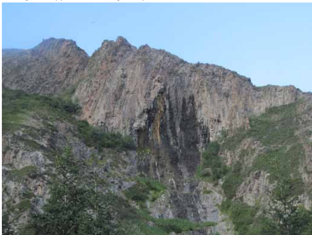
Тамчы-Булак, Ат-Башы району